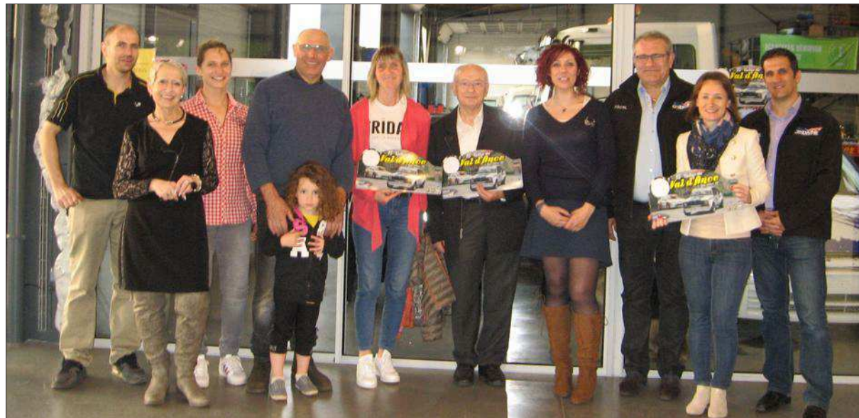
■ Le garage Satre qui recevra le rallye, les organisateurs de l'ASA Ondaine et les membres de la municipalité de Beauzac et Bas-en-Basset.

107 km, c'est la distance des neuf spéciales qui auront lieu lors de ce rallye.