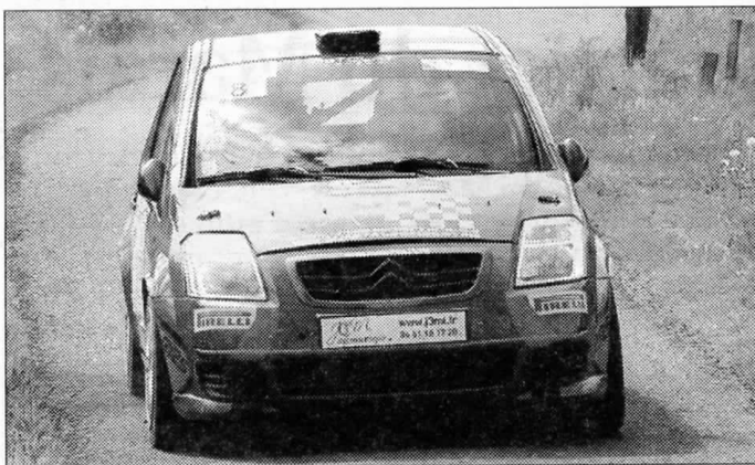
Bastien Guiot est monté sur la troisième marche du podium avec sa Citroën C2.