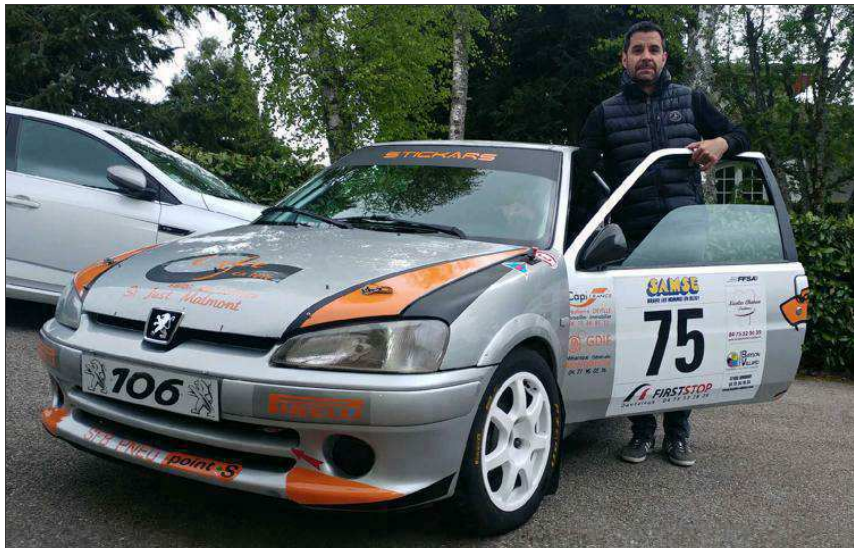
■ Le pilote sera au volant d'une Peugeot « 106 S 16 ».

Concentré autour de la commune, son coefficient 3 permettra de marquer des points importants pour la 15 e édition de la course, samedi.