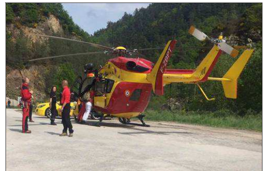
■ L'hélicoptère Dragon 63 a transporté le conducteur à l'Hôpital Nord de Saint-Etienne.