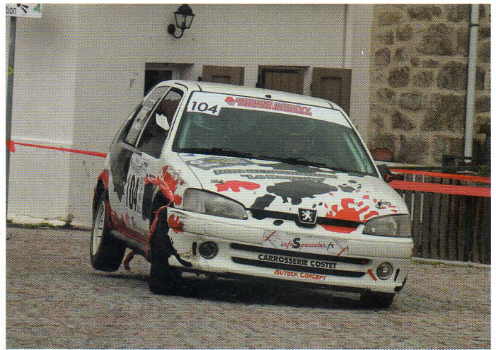
| M. Boulakhlas confirme avec cette belle performance.