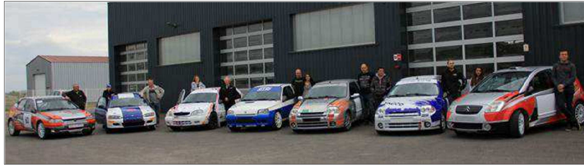
■ Une partie des équipages beauzacois.

Vendredi, dès 16 heures, le garage Satre, à la zone artisanale de Pirolles, accueillera les 125 voitures qui prendront part au rallye national du Val d'Ance pour les vérifications techniques et administratives. Une buvette point de restauration rapide sera mise en place par l'association des commerçants et artisans beauzacois Boz'ac.