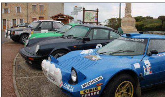
■ Les voitures ont étonné nombre d'habitants.