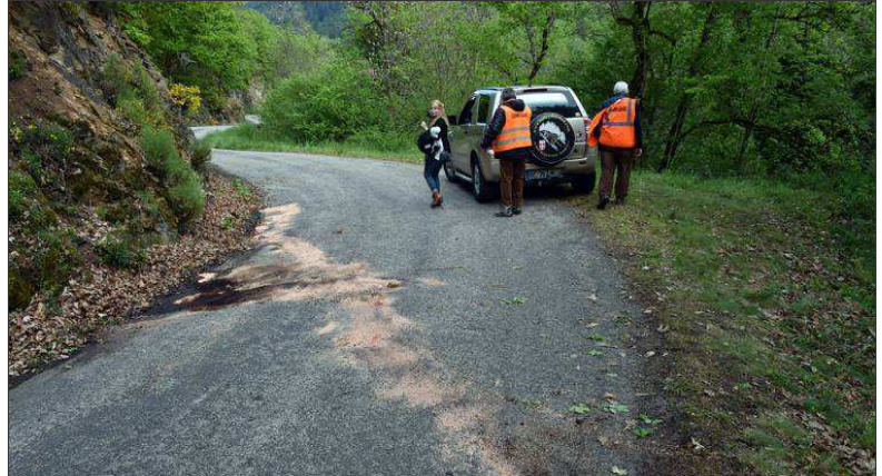
■ L'Alpine « A310 » montait lorsque le conducteur a perdu le contrôle à l'intérieur du virage et a filé tout droit en direction du ravin.

De gros moyens de secours sont dépêchés sur place. Médicalisé par le SAMU 42, le conducteur sera finalement hélitreuillé par l'hélicoptère Dragon 63, de la Sécurité civile du Puy-de-Dôme, et