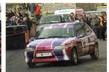
| Emeline Breuil est de retour aux affaires.