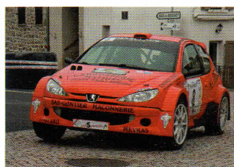
| Masclaux termine superbe 2e après une belle bagarre.