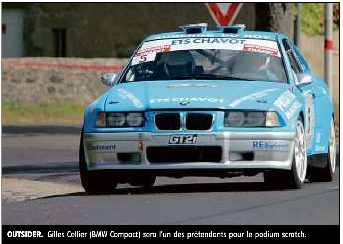
OUTSIDER. Gilles Cellier (BMW Compact) sera l'un des prétendants pour le podium scratch.

1 25 engagés sur le rallye moderne, 6 pour la première édition VHC proposée en parallèle et enfin 26 équipages au départ de la première ronde historique du Val d'Ance (non chronométrée). Cette année a retrouvé des couleurs, après les 89 engagés de l'an dernier. L'épreuve phare de l'ASA Ondaine a gagné en notoriété, sur des épreuves spéciales comme Tiranges ou Bas-Saint-Hilai-