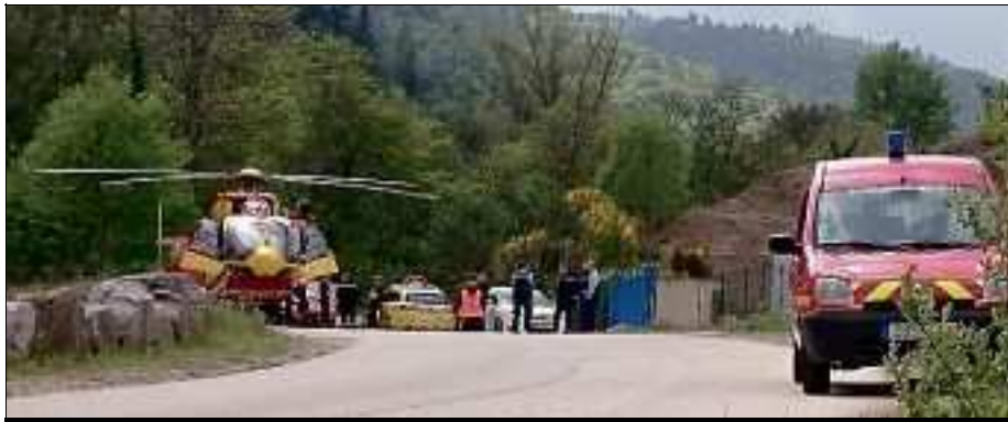
SORTIE DE ROUTE. Le conducteur de l'Alpine Renault A310 et son copilote ont été gravement blessés dans la sortie de route, mais leurs jours ne seraient pas en danger.

L'accident s'est produit vers 13 h 30, peu avant la reprise de la spéciale. Le temps d'une pause déjeuner, les voitures de collection ont pris le relais sur le circuit pour divertir les spectateurs. Une Alpine Renault A310 ( lire par ailleurs ) est la dernière à avoir défilé.