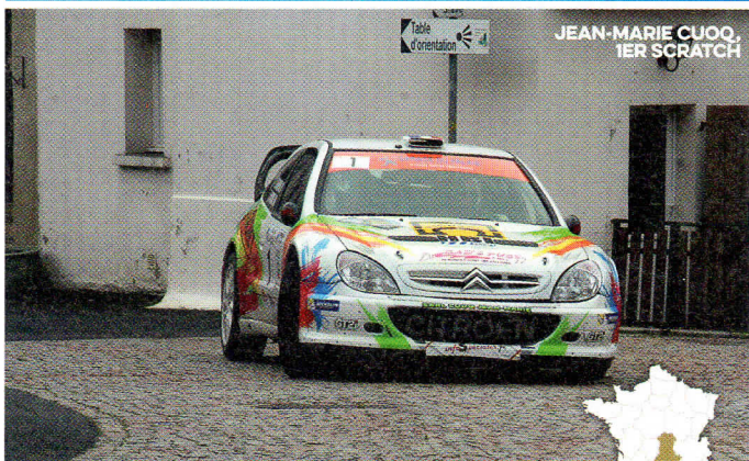
JEAN-MARIE CUOOQ, 1 ER SCRATCH