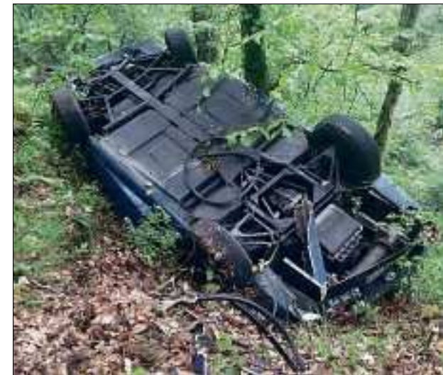
CHUTE. L'Alpine Renault a été stoppée par un arbre.