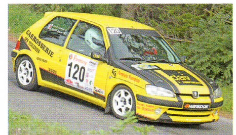
| Garde prend à son compte la N2.