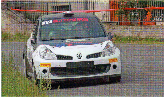
| Combe est aussi à l'aise au volant qu'aux notes !

Par Francis Rossi