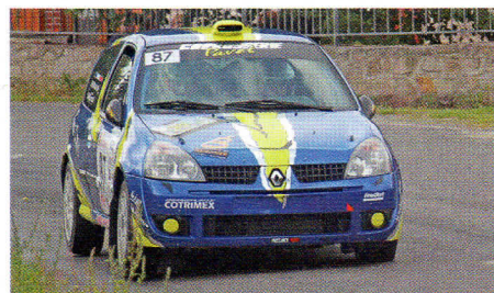
| 3e Gr N, Vignier s'impose en N3.

Qualifié pour la finale, Cessac fait une belle répétition en enlevant le groupe et la A8. Pour son retour, Messy a roulé crescendo, signant de bons chronos sur la fin, et termine 2e du groupe, 1er A7K, 2s3 devant Jacques