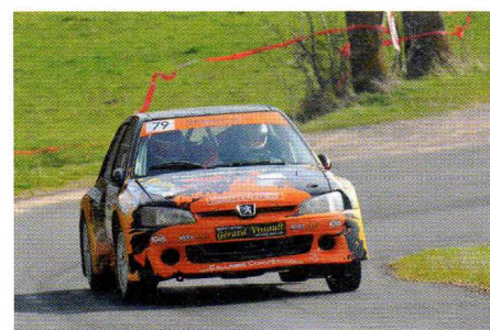
La classe F2000/13 revient à Abrial.