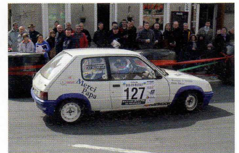
Valcourt s'adjuge la N1 avec une belle place au scratch.

Peyrache forfait, Palais arrête à une ES de la fin (panne d'Intercom).